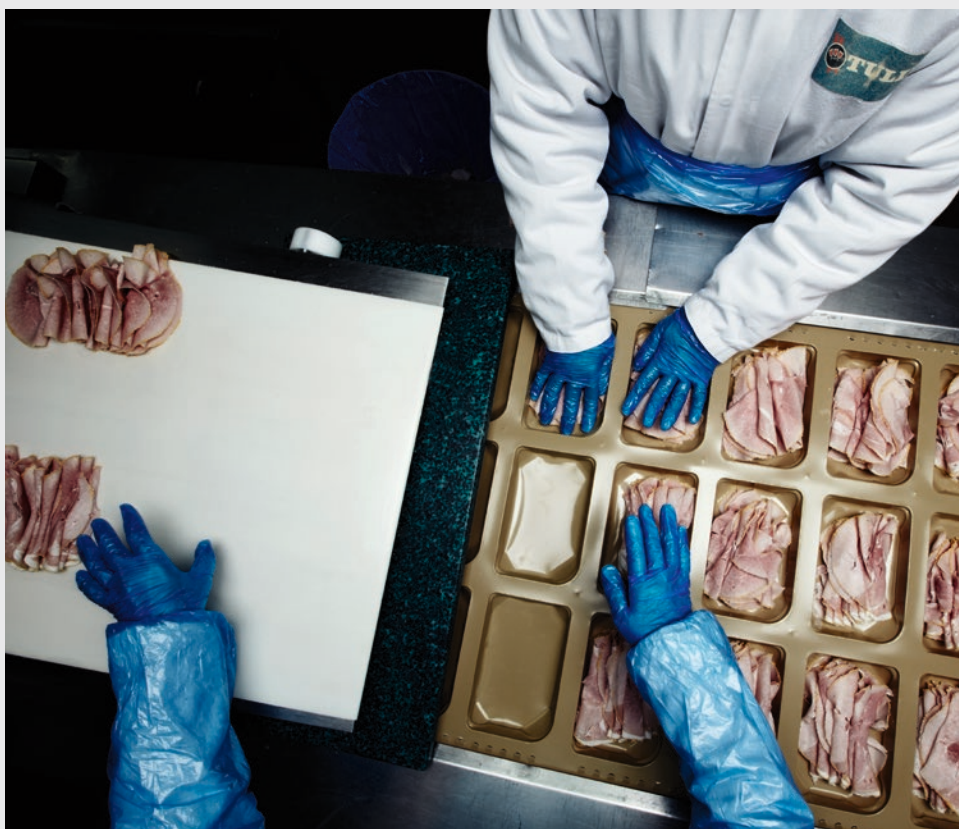
Det er primært i den engelske del af forretningen samt funktionærer, der vil blive ramt af den varslede spareplan.

Danish Crown har cirka 29.000 medarbejdere globalt, heraf cirka 9.000 i Danmark og 7.000 i Storbritannien. ■